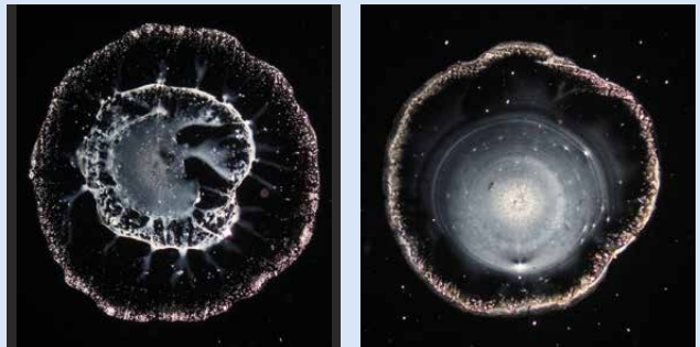
Bildliche Darstellung von Leitungswasser vor (links) und nach Kontakt (rechts) mit Pflanzen-Flüssigkeit, der Elementarsubstanz aus einem Weinstock.

Vortrag Freitag, 23. Juni · um 19 Uhr (Eintritt 10,- €)