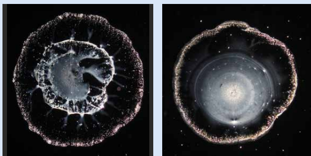
Bildliche Darstellung von Leitungswasser vor (links) und nach Kontakt (rechts) mit Pflanzen-Flüssigkeit, der Elementarsubstanz aus einem Weinstock.

Zwei-Tages-Seminar Samstag, 12. August · von 9.30 bis 17.00 Uhr Sonntag, 13. August · von 9.30 bis 15.30 Uhr